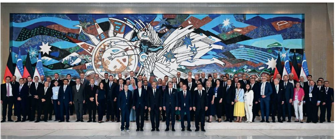
OA-Gesamtdelegation mit dem usbekischen Ministerpräsidenten Abdulla Aripov

Einer der zentralen Schwerpunkte lag auf dem Thema Fachkräftesicherung und berufliche Bildung. Dieses Thema ist für beide Länder von besonderer (Lesen Sie weiter auf Seite 6)