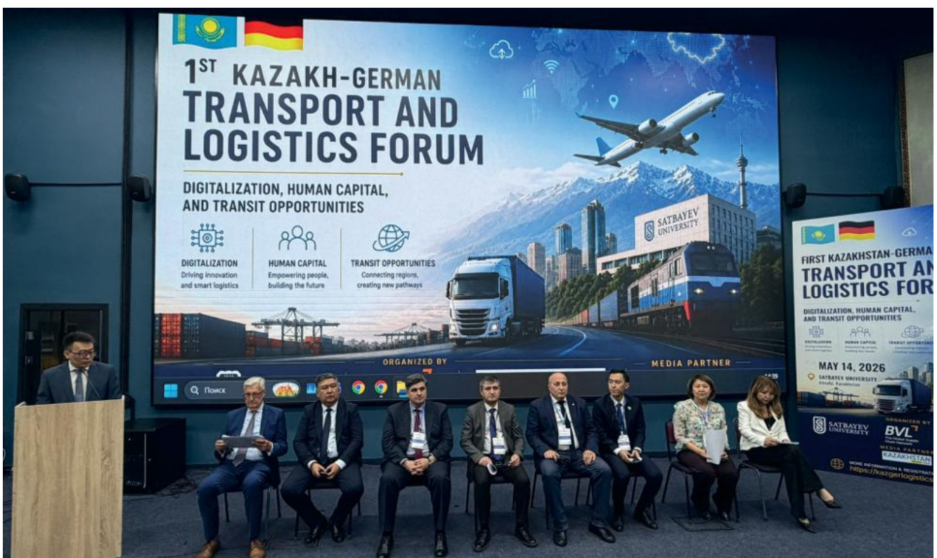
Transport- und Logistikverbände aus Deutschland, Zentralasien und dem südlichen Kaukasus

Ein Schwerpunkt des Forums lag auf dem Transkaspischen Transportkorridor (TCTC). Dieses Netzwerk verschiedener Routen verbindet Ostasien über Zentralasien, das Kaspische Meer, Aserbaidschan, Georgien, das Schwarze Meer und die Türkei mit Europa. Die Strecke von Lia-