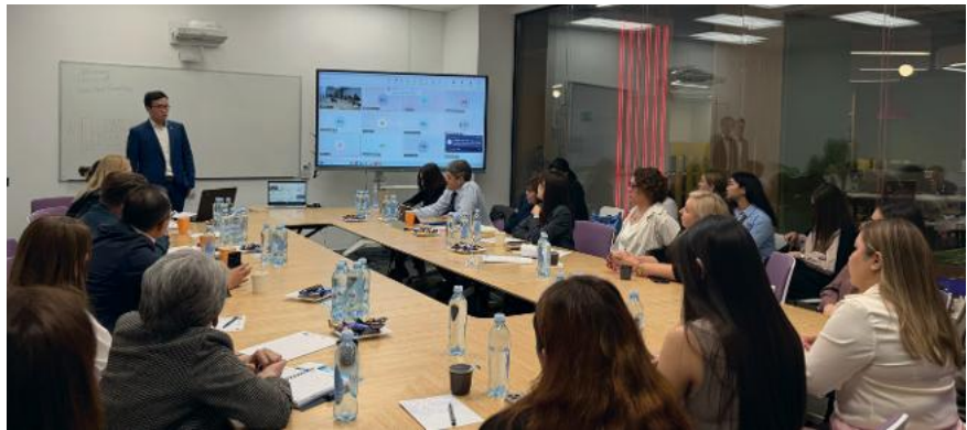
Informationsveranstaltung zur Beantragung eines Schengen-Visums am 28. Mai 2026 in Almaty

@ Wenn Sie Informationen über Ihr Unternehmen, bestehende oder geplante Kooperationen mit Kasachstan sowie Ihre Vorschläge und Anmerkungen mitteilen möchten, senden Sie uns bitte eine E-Mail an: info@successbyinformation.com