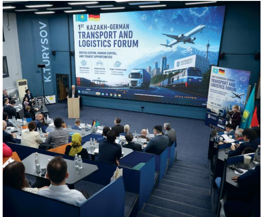
Das erste Kasachisch-Deutsche Transport- und Logistikforum am 14. Mai 2026 in Almaty

Entsprechend konstruktiv war die Atmosphäre des Forums. Die Veranstaltung verband analytische Beiträge mit konkreten Geschäftsgesprächen und bot Raum für Begegnungen zwischen Unternehmen, Verbänden, Hochschulen und Akteuren der Entwicklungszusammenarbeit. Die wichtigste Botschaft aus Almaty war vielleicht: Konnektivität entsteht nicht allein auf Karten oder in Strategiepapieren. Sie entsteht dort, wo Fachleute Verfahren vereinfachen, Unternehmen Vertrauen aufbauen, Hochschulen Kompetenzen entwickeln und Partner gemeinsame Projekte auf den Weg bringen.